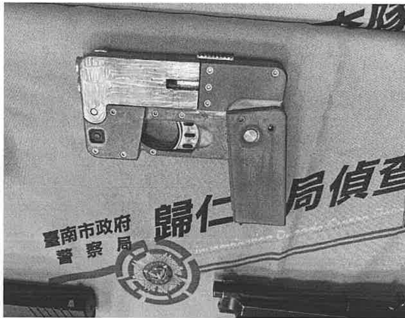
歸仁警方起出罕見的手機型改造手槍。