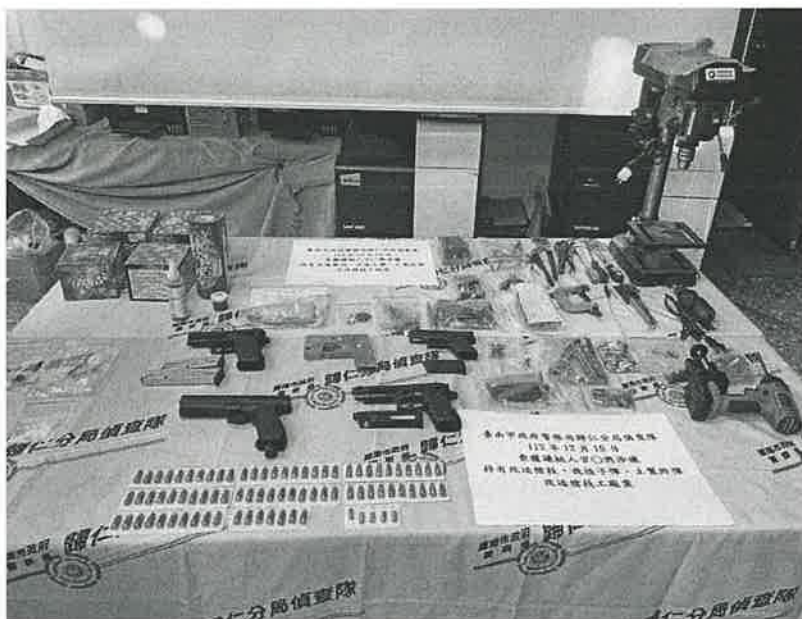
歸仁警方逮捕官姓男子，破獲槍枝改造案。