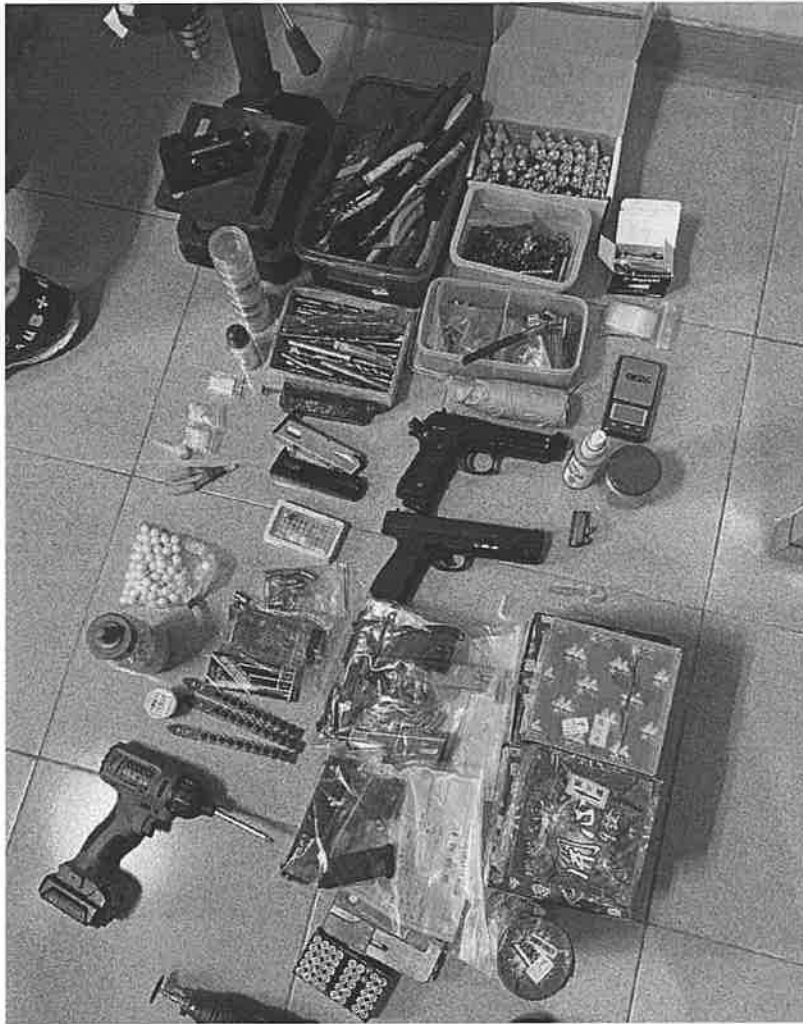
歸仁警方逮捕官姓男子，破獲槍枝改造案。