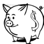
私校退撫儲金(新制)-自主投資

3. 資料來源：財團法人中華民國私立學校教職員退休撫卹離職資遣儲金管理委員會網站公告資料。